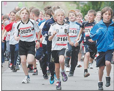
Platz da, jetzt kommen wir: Ganze Schulklassen starteten.