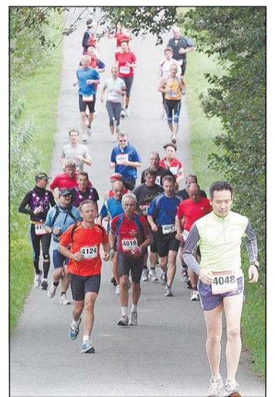
Wacker, wacker: Läufer-Hochbetrieb an einer Steigung.

Mehr Fotos im Internet: www.westfalen-blatt.de