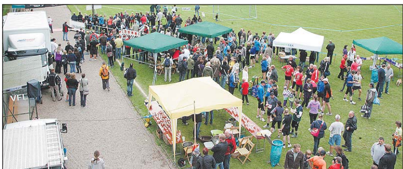
Trubel am Kattenbusch: Trotz des enormen Andrangs hatte das Organisationsteam alles im Griff.